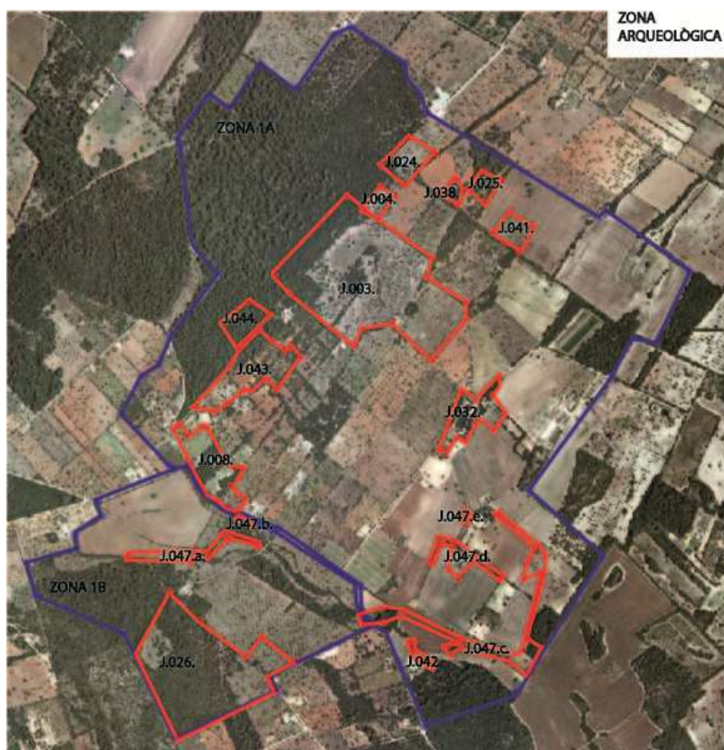
Foto aèria de la zona arqueològica 1. Son Bessó – Sa Sínia– S' Hort de Son Rossinyol.

La zona B inclou les següents parcel·les del Polígon 7: 671, 689, 692.