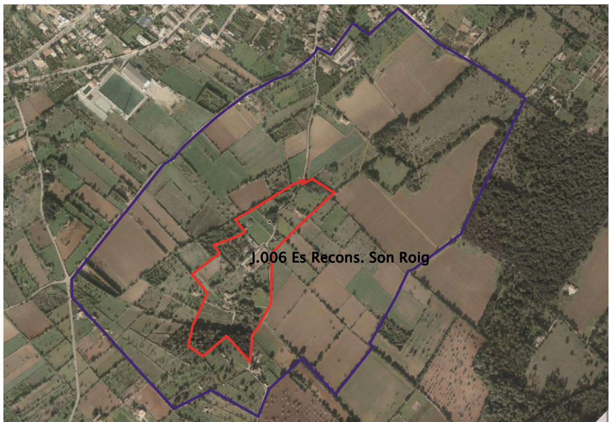
Foto aèria de la zona arqueològica 2. Es Racons Son Roig.

La zona Inclouria les següents parcel·les del polígon 7: 410, 415, 416, 417, 418, 419, 420, 421, 422, 425, 426, 427, 428, 431, 432, 434, 447, 448, 449, 450, 451, 454, 460, 461, 462, 463, 464, 484, 485, 487, 488, 489, 490, 491, 492, 493, 495, 496, 497, 498, 499, 500, 501, 502, 503, 505, 506, 507, 508, 716, 717, 724, 725, 748, 789, 790, 791, 793, 792.